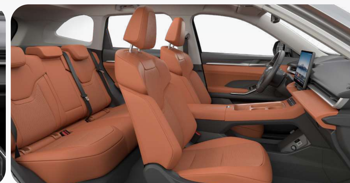
Vestiduras de piel sintética / Café-Negro (Sólo para versión Luxury PHEV con color exterior gris)