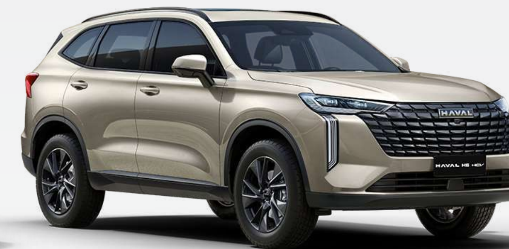
Golden (Solo en versiones Luxury)