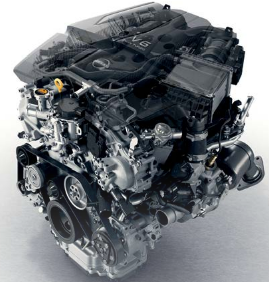
Motor V6 Twin-Turbo de 3.0 litros, 400hp y 350 Lb-pie de torque

Nissan Z cuenta con nuevos amortiguadores monotubo, una nueva geometría delantera frenos Akebono (r) de 4 pistones y puesta a punto de la suspensión trasera pensados para ofrecer una experiencia de manejo sobresaliente. La dirección asistida eléctrica permite mejor maniobrabilidad para un control y una precisión excepcionales.