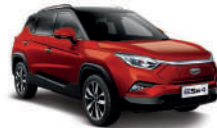
Extreme Red Bicolor