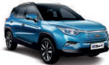
Electric Blue Bicolor