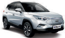
Arctic White Bicolor