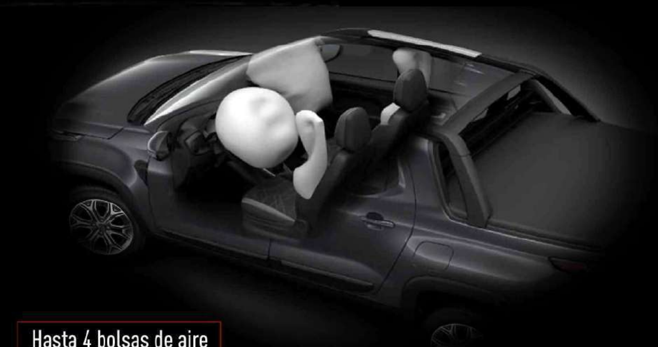
Hasta 4 bolsas de aire

*Barras de protección de ventanilla trasera no disponible en ninguna versión de RAM 700