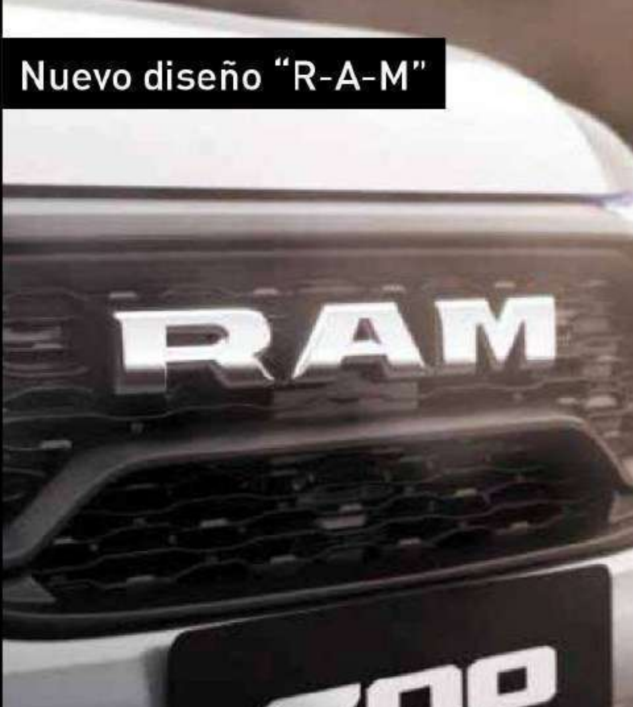
Nuevo diseño "R-A-M"

ya que cuenta con los elementos necesarios para dominar y sobresalir de los demás de manera cómoda, segura y tecnológica.