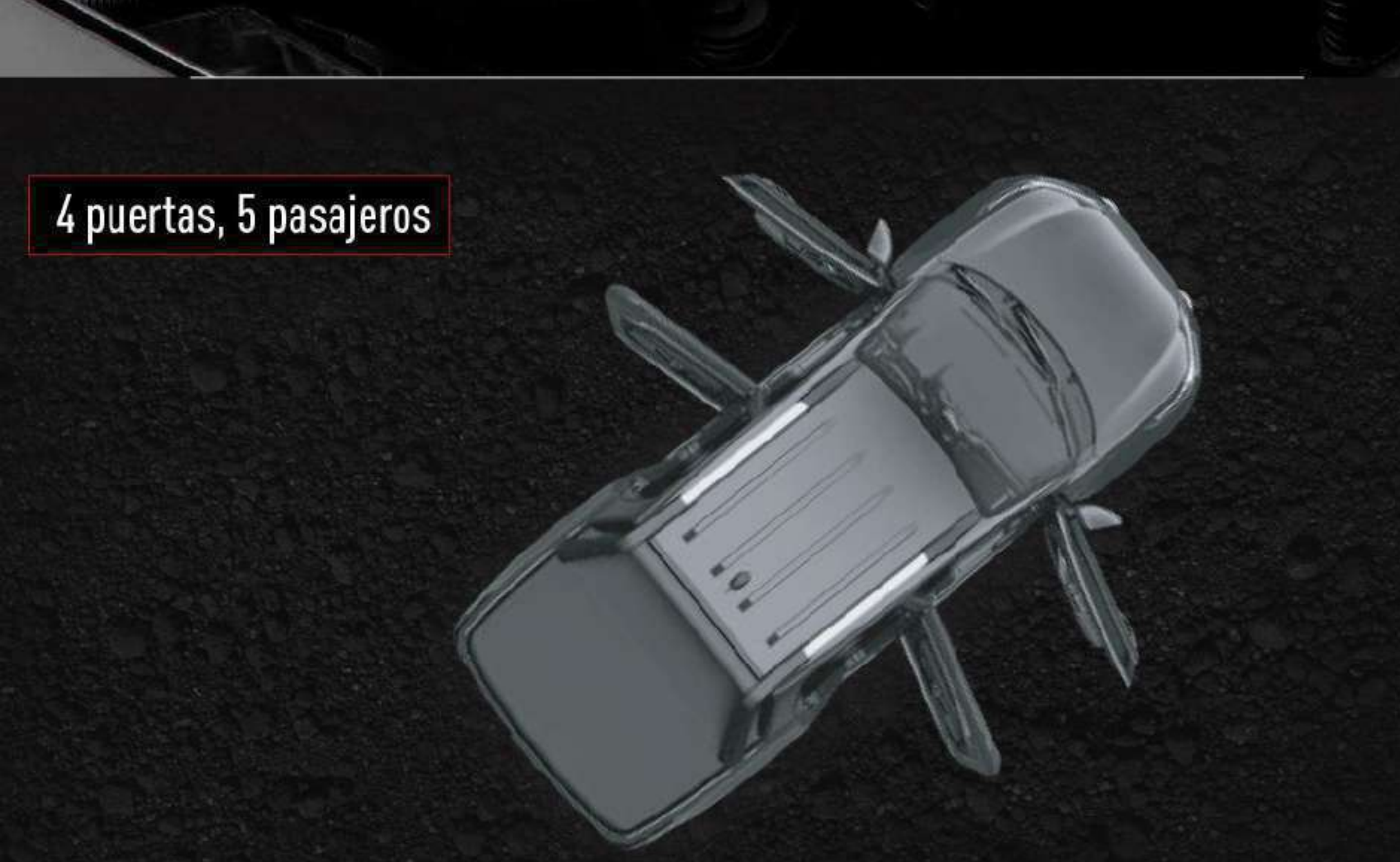
4 puertas, 5 pasajeros