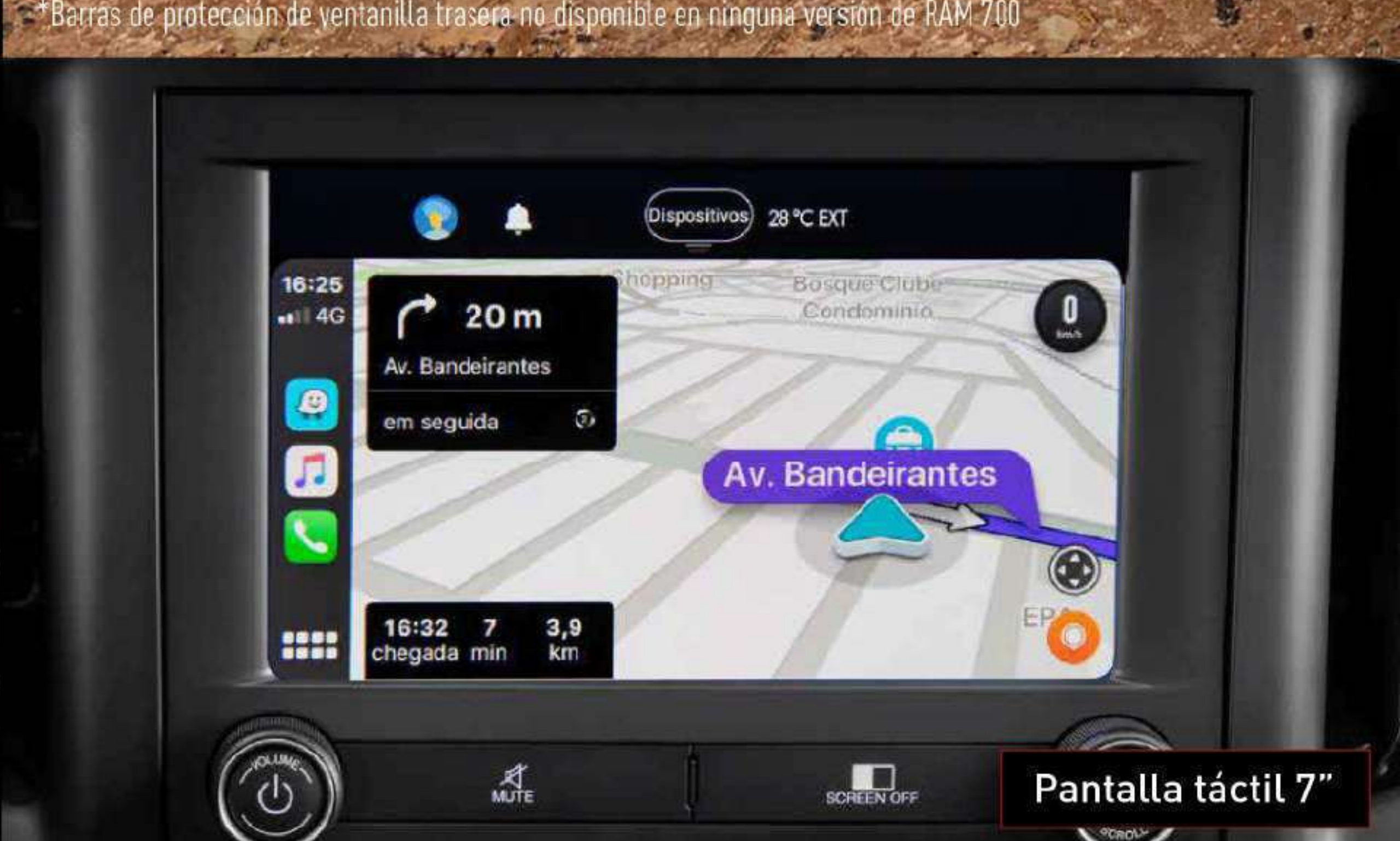
Pantalla táctil 7"