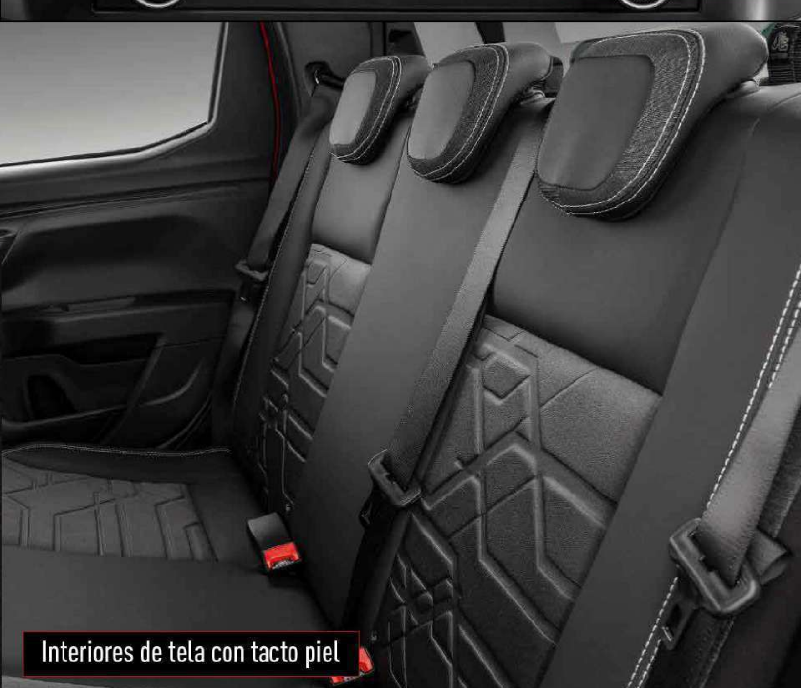
Interiores de tela con tacto piel