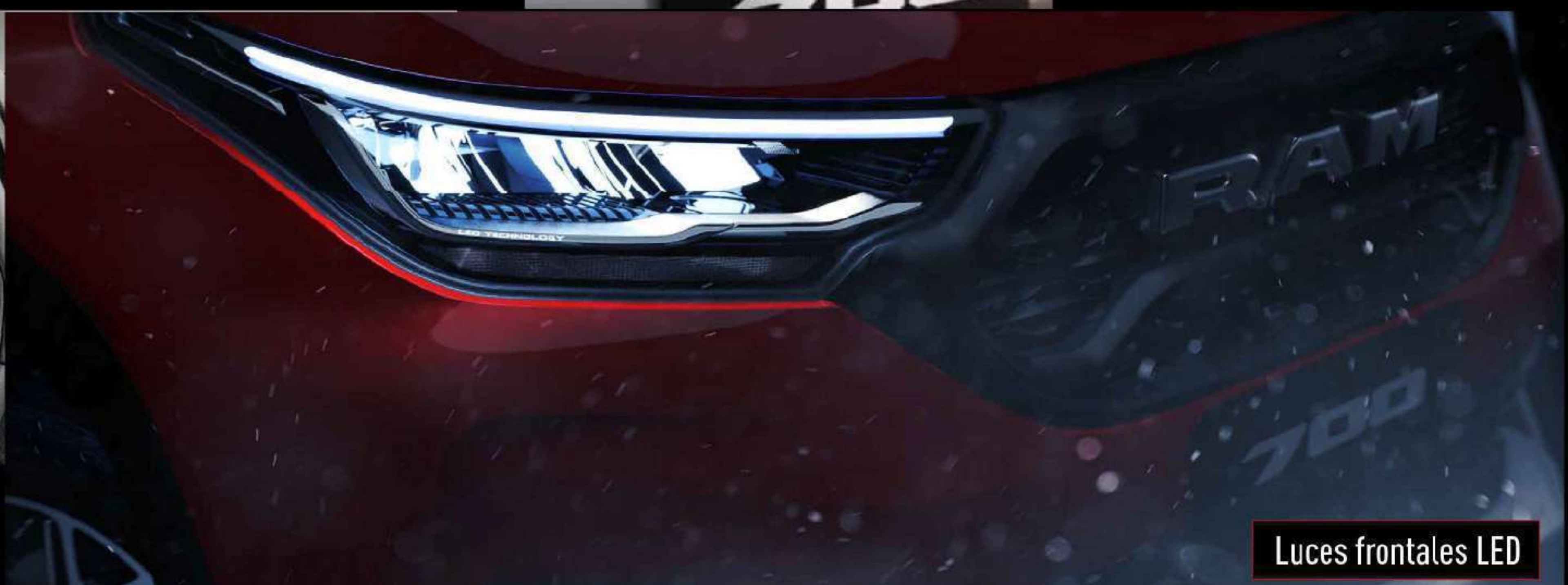
Luces frontales LED