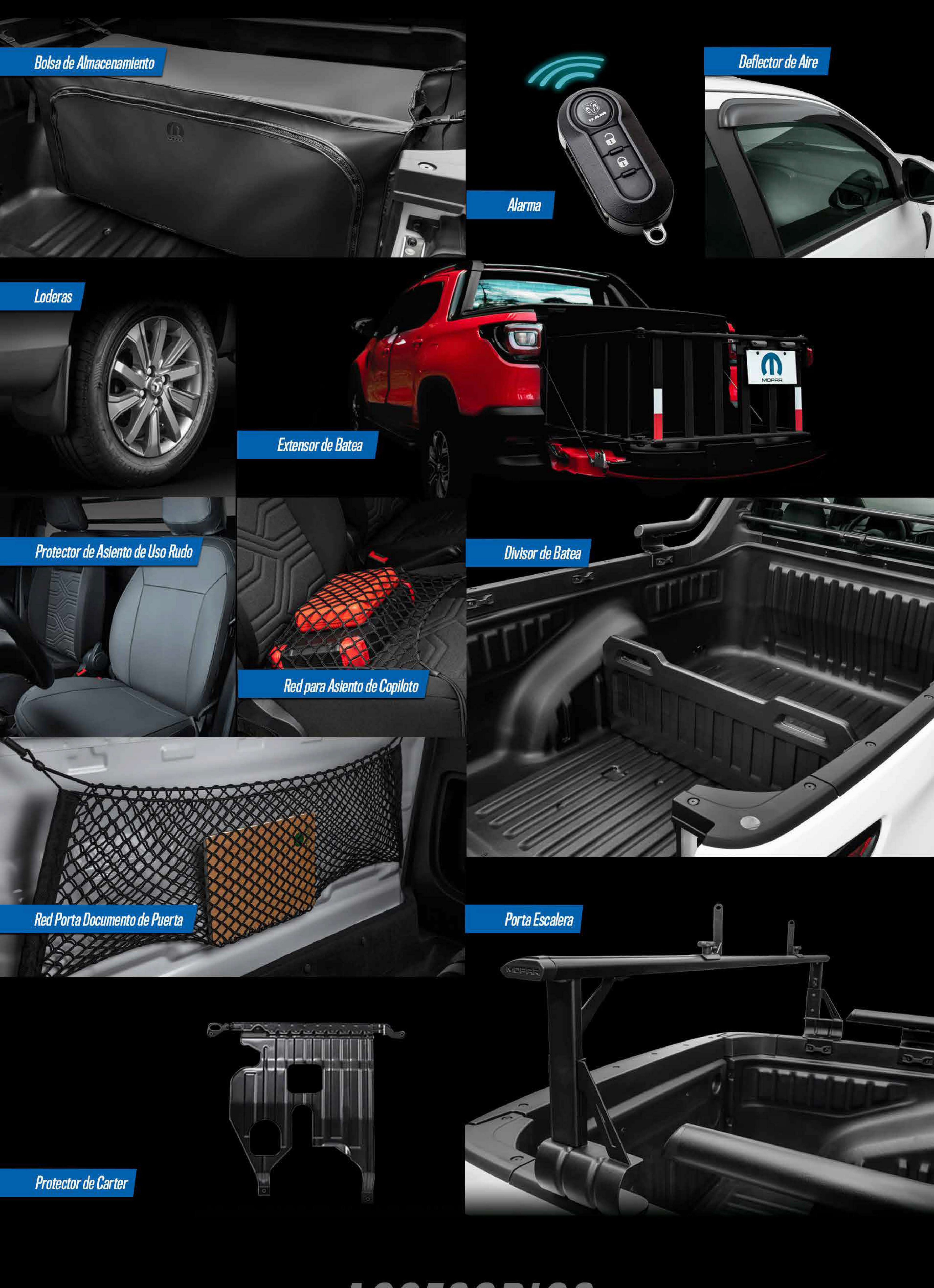
Bolsa de Almacenamiento