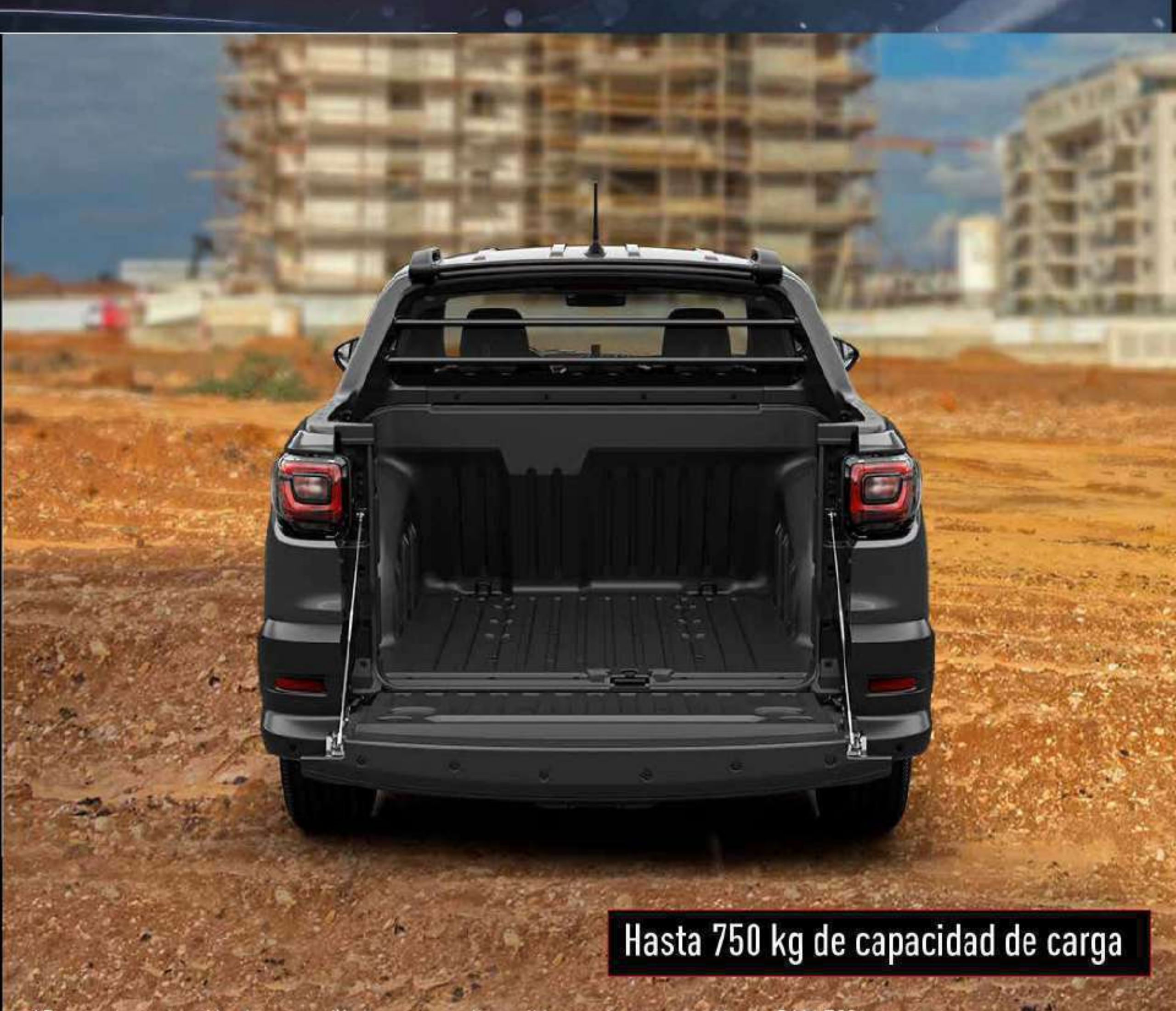
Hasta 750 kg de capacidad de carga

*Barras de protección de ventanilla trasera no disponible en ninguna versión de RAM 700