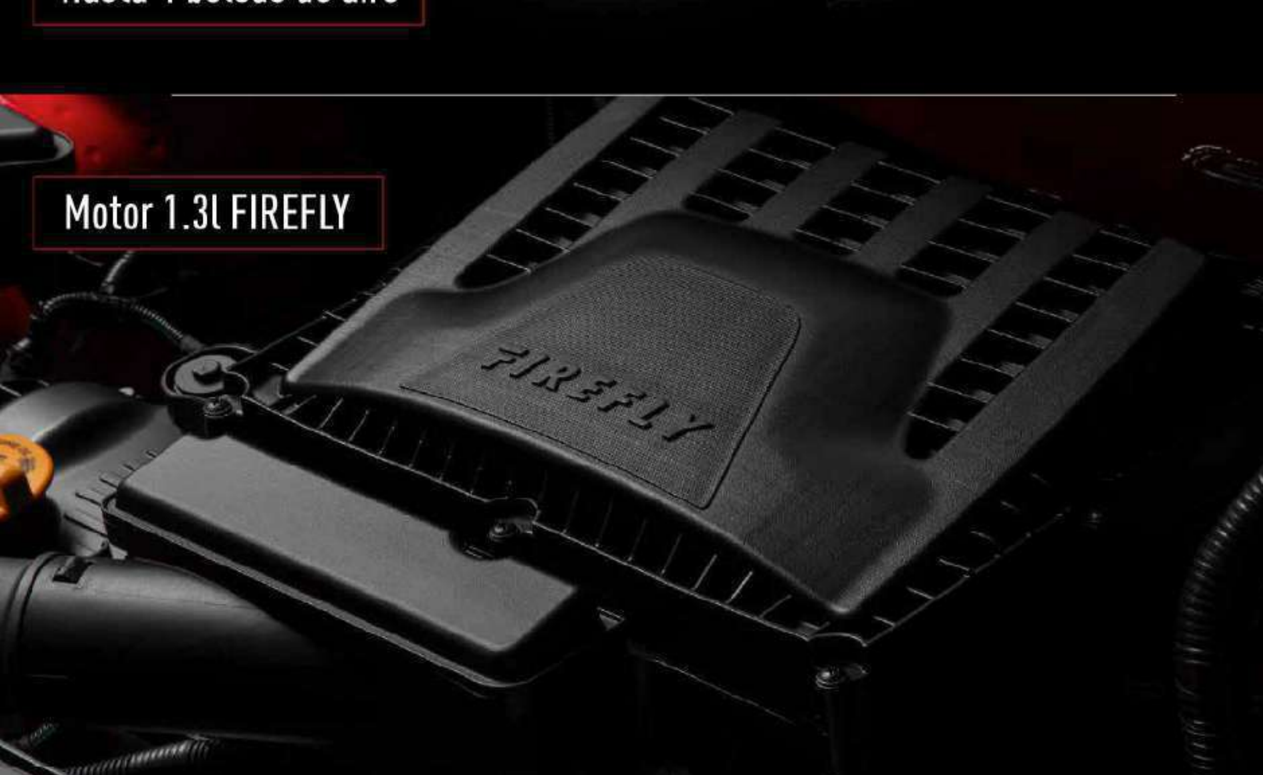
Motor 1.3L FIREFLY