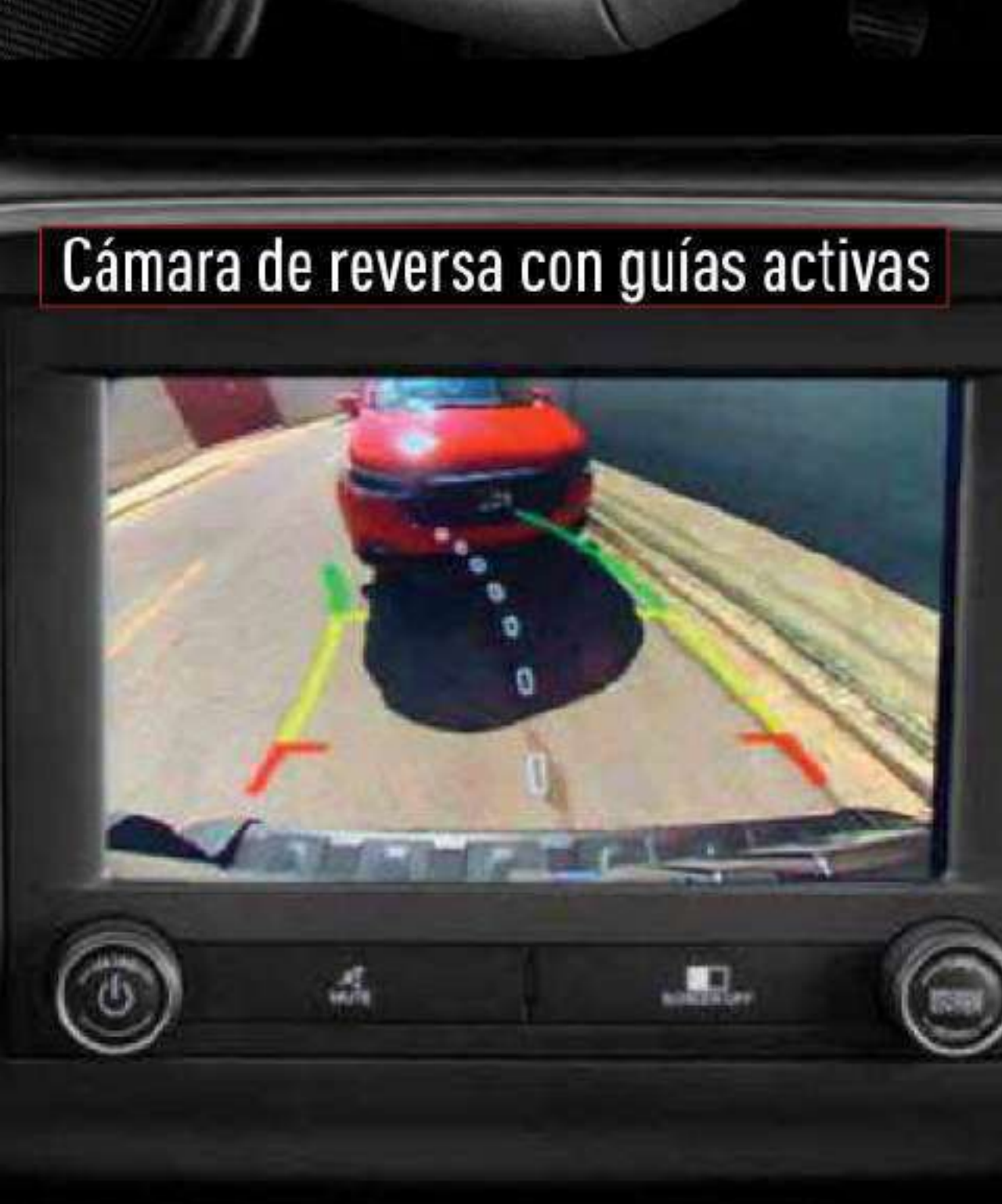
Cámara de reversa con guías activas