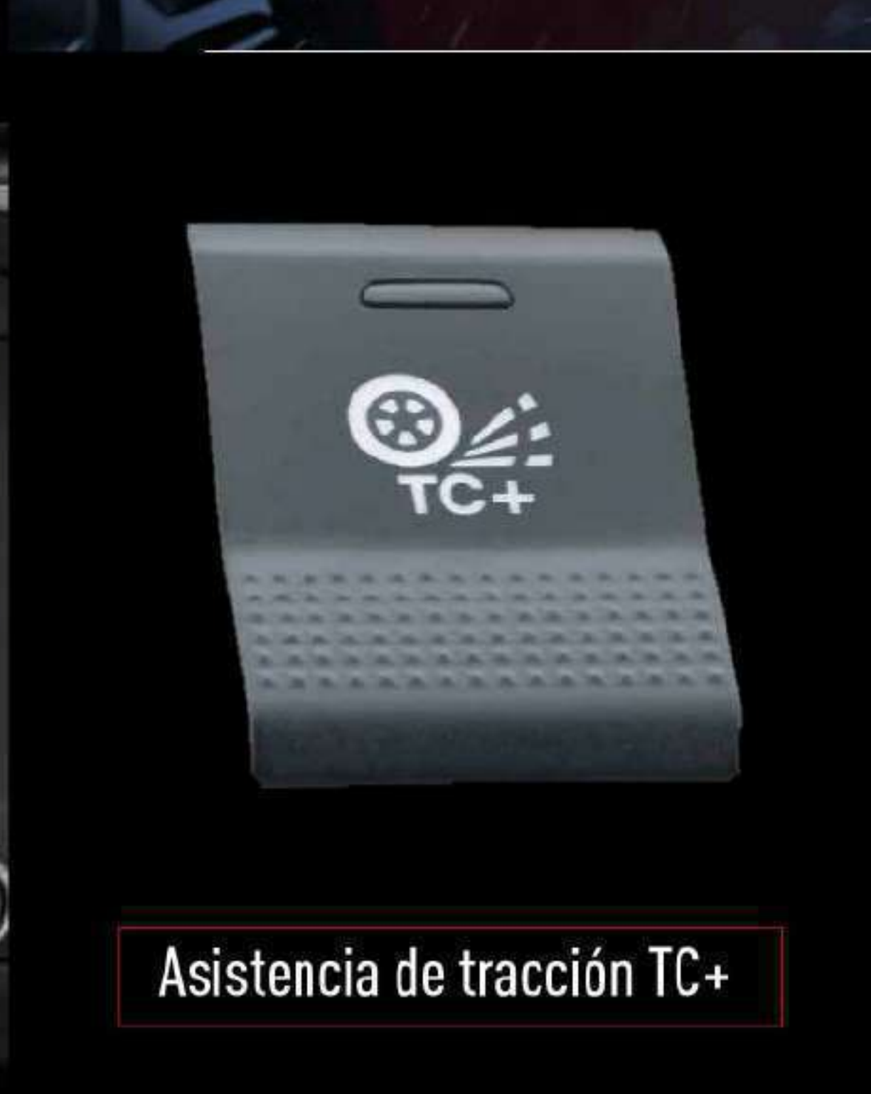
Asistencia de tracción TC+