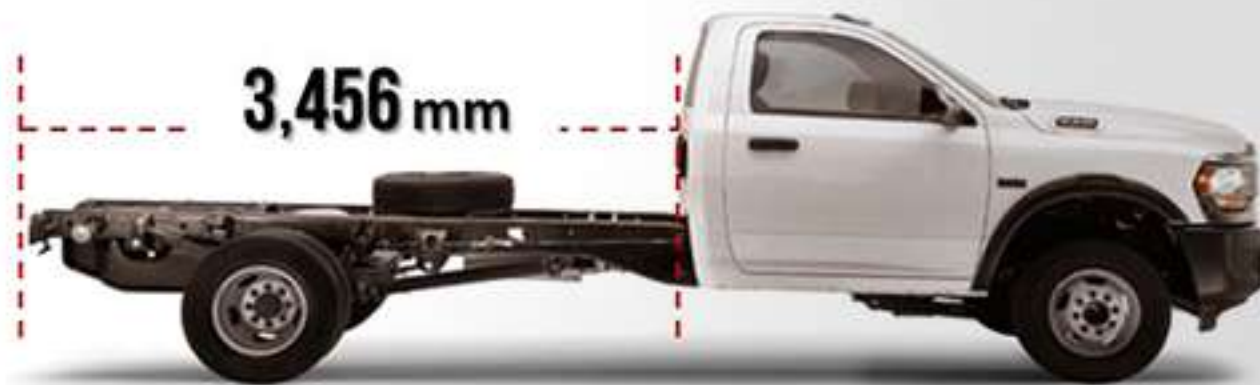
CHASIS PLANO LARGO