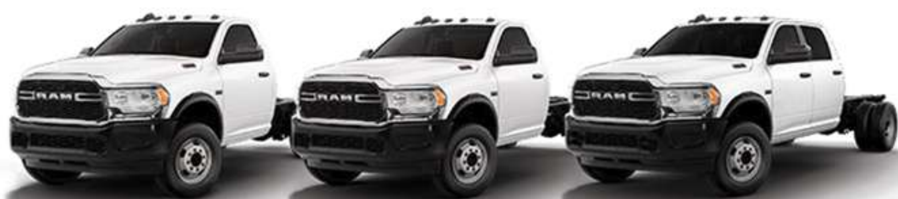
RAM 4000 - P

Te presentamos RAM 4000 2022 MY, el camión HD de la gama comercial de RAM con capacidades, seguridad, diseño y tecnología en cada una de sus versiones que brindan una solución integral a cualquier tipo de aplicación.