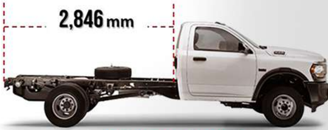
CHASIS PLANO CORTO