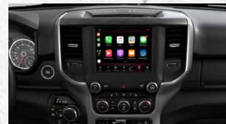
SISTEMA UCONNECT 5" GEN CON PANTALLA DE 8.4"