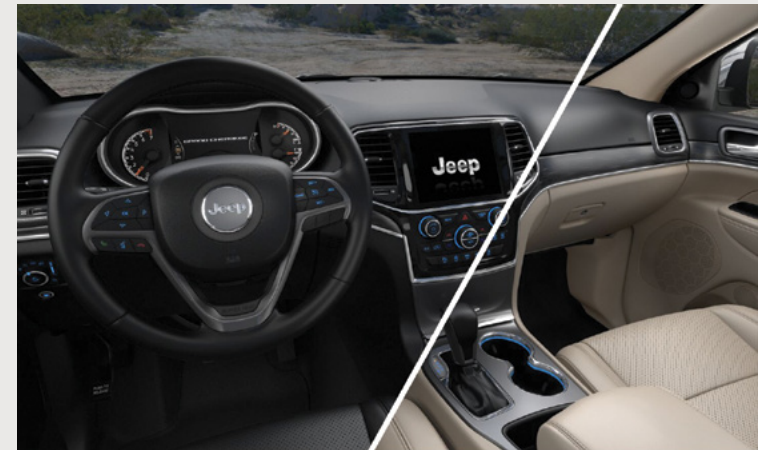
INTERIORES EN NAPPA NEGRO O BEIGE

©Stellantis México, S.A. de C.V. 2022. El contenido de la presente ficha es estrictamente informativo por lo que no constituye oferta alguna. Todas las características, colores, equipo, materiales, especificaciones, marcas y/o accesorios de los vehículos aquí listados y/o mostrados están basados en información disponible a la fecha de impresión de febrero 2022 y podrán cambiar sin previo aviso de acuerdo al inventario disponible, las circunstancias del mercado y/o a las innovaciones tecnológicas, por lo que Stellantis México, S.A. de C.V. se reserva el derecho de modificarlos en cualquier momento sin incurrir en ninguna obligación o responsabilidad. Visita www.jeep.com.mx para obtener la información más actualizada de los vehículos que se ofrecen al público y demás términos y condiciones aplicables. Consulta términos, condiciones, así como la Garantía Uniforme (defensa a defensa) 3/60, 3 años o 60,000 km en www.jeep.com.mx o con tu distribuidor autorizado. Rendimiento de combustible obtenido con base en los resultados de pruebas de laboratorio realizadas bajo condiciones controladas de manejo, de conformidad con la NOM-163 SEMARNAT-ENER-SCF-2013. Se entiende por condiciones controladas de manejo aquellas sujetas a variables que puedan afectar el rendimiento de combustible tales como la altitud, la temperatura ambiente, condiciones de tráfico, velocidades, tipo de aceleración, entre otras. Jeep, y Mopar, son marcas registradas en favor de FCA US LLC.