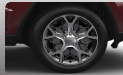
Rines de aluminio de 20" con diseño pulido Tech Gray