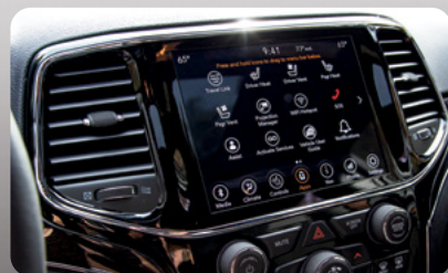
Sistema Uconnect ® 8.4 Nav con pantalla touch de 8.4"