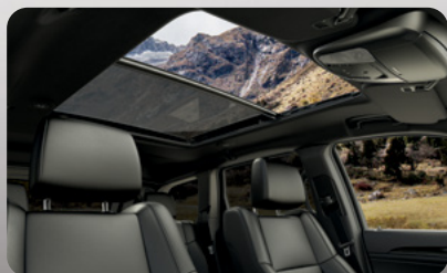
Quemacocos dual panorámico CommandView ®