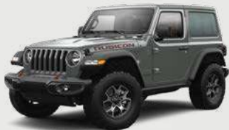
GRIS MANTARRAYA NO DISPONIBLE PARA SAHARA Y RUBICON UNLIMITED