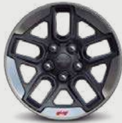
Rines de aluminio de 17" Neumáticos LT 255 / 75 R17C