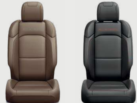
Asientos Rubicon con piel premium café