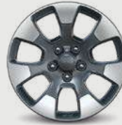
Rines de aluminio de 18" Neumáticos 255 / 70 R18 All Season