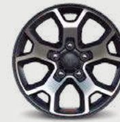
Rines de aluminio de 17" Neumáticos LT 255 / 75 R17C