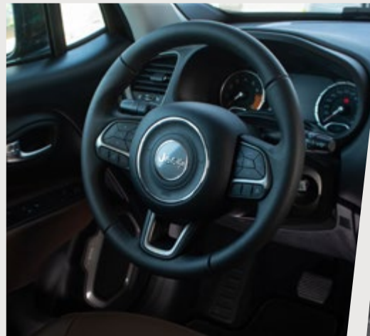
Controles de audio y teléfono al volante