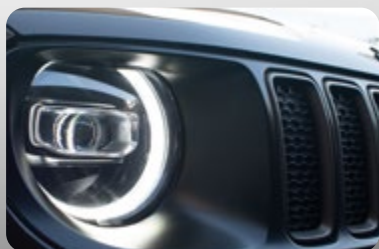
Faros de niebla delanteros LED