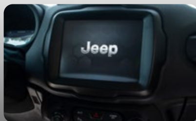
Sistema Uconnect® de 8.4" con pantalla táctil y conexión inalámbrica de Android Auto™ y Apple CarPlay®