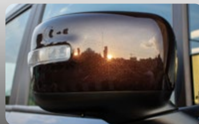
Espejos exteriores al color de la carrocería con ajuste eléctrico