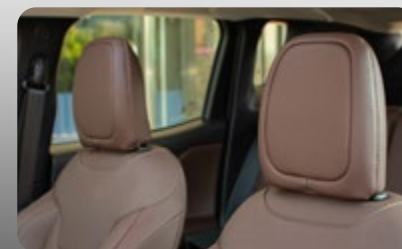
Asientos tapizados en piel de color café