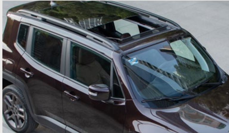
Quemacocos dual panorámico CommandView®