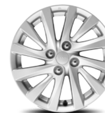
// ALUMINIO DE 15" PARA SXT