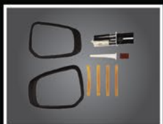
PROTECTORES DE ESPEJOS