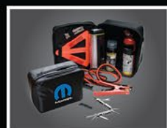
KIT DE EMERGENCIA