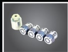
BIRLOS DE SEGURIDAD