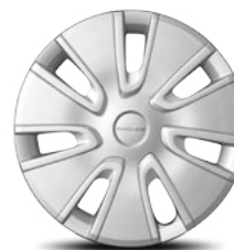
// ACERO DE 14" CON TAPÓN PARA SE