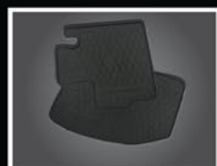
TAPETES DE USO RUDO